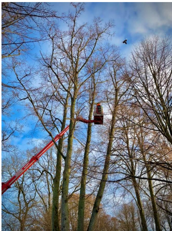
Trädbeskärning på Carl Westmans Allé

Källa: Skogsencyklopedin, utgiven av Sveriges Skogsvårdsförbund (numera Föreningen Skogen), Stockholm år 2000. Redaktör: Michael Håkansson.”