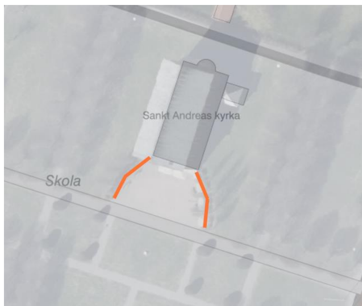
Sankt Andreas kyrka på Borggården

Nyplantering av 100 vitblommande rhododendronbuskar är beställd och arbetet kommer att ske vid rätt tillfälle. Jorden kommer att förbättras innan plantering.