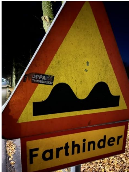
Skylt innan sanering

Klotter avlägsnas i princip så fort vi upptäcker det. Oftast är det på våra byggnader. Klistermärken på våra trafikskyltar har under en tid blivit fler och det var dags att se över dem. De har nu tvättats och klistermärken har avlägsnats.