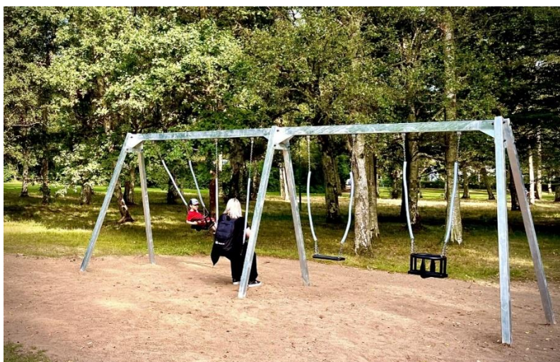
Gungor på lekplatsen vid Carl Westmans Allé

Under sommaren har gungorna med ställning bytts ut på lekplatsen. Standarden har förbättrats och anläggningen fyller nu kraven på säkerhet. En allmän uppfrysning av övrig lekutrustning har också skett. Dessutom finns det nu en sittplats med bord i direkt anslutning till lekplatsen.