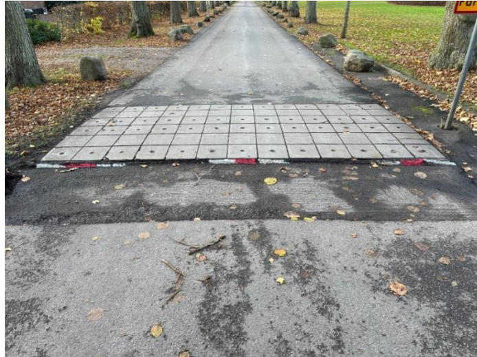
Förberedande arbete innan asfaltering vid ett farthinder