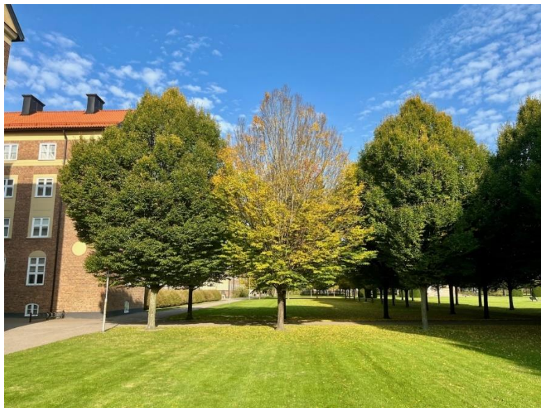
Pyramidbok på Borggården

Det har sedan några år uppmärksammats att vissa träd på Borggården saknar livskraft. En utredning med prover har skickats runt till specialister. Detta utan framgång. Misstankar om att marken är vattenfylld och "kväver" träden kvarstår. Under våren kommer vi att prova att grävsuga ur och fylla rotsystemet med biokol på ett antal träd. Metoden gör att ett resultat kan ses först om ett par år efter ingrepp.