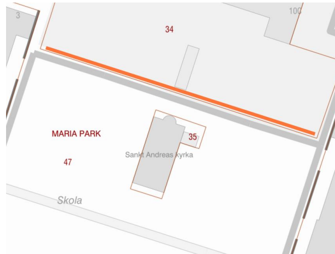
Sträckning av kulvert

Arbetet med kulverten på Borggården är pågående. Nio träd i anslutning till kulverten får fällas och ska ersättas enligt gällande detaljplan 1283K-13637 som gäller för hela Maria Park.