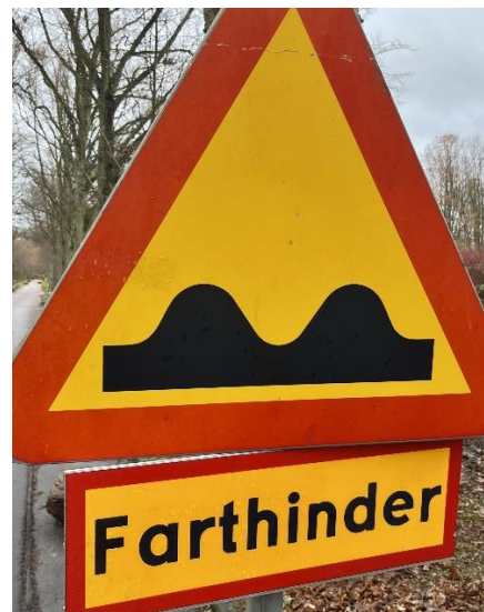
Skylt efter sanering